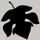
Ull de Llebre Tempranillo